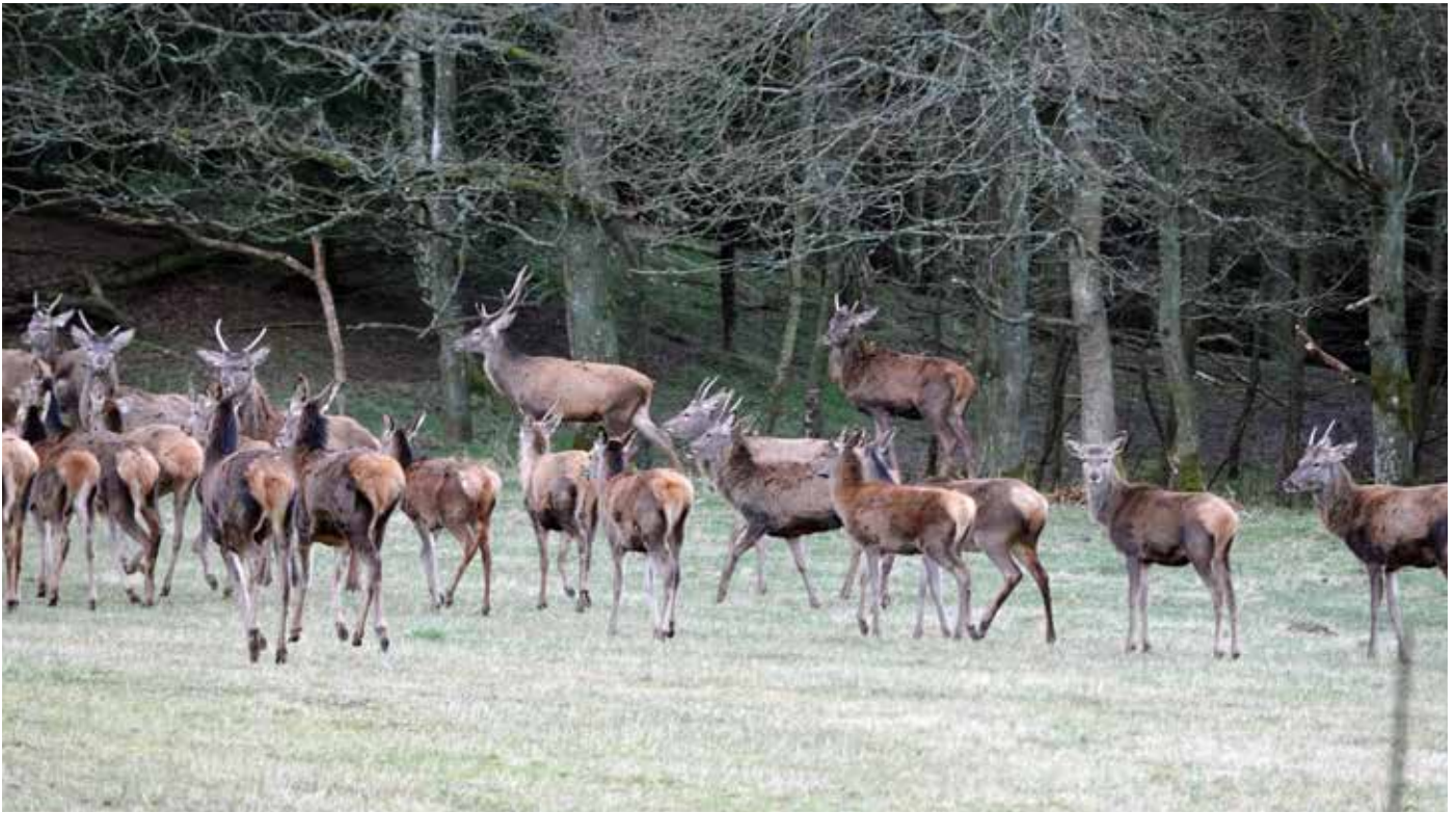
Den kropslige størrelse på spidshjorte kan variere meget.

Medmindre de jægere, der indrapporterer køn på deres nedlagte kalve, foretager bevidst kønsselektion i deres afskydning af kronkalve, må vi se det indberettede som en valid stikprøve af kønsforholdet blandt kronkalve. Allerede studier fra Vildtbiologisk Station i 1960'erne indikerede, at flere delbestande havde en overvægt af hundyr blandt kalvene. Årsagerne hertil kan være komplekse, se Jæger 8/2018 s. 80-82. En forskydning imod en overvægt af hundyr starter allerede ved de kalve, der undfanges. Årsagen til disse forskydninger er alle forhold, der afviger fra de eksisterende forvaltningsmålsætninger. Det er derfor ikke et validt argument at fremføre, at det er naturligt, at der er flere hun- end handyr i vores hjortevildtbestande. Det er nemlig en naturlig reaktion på, at der forvaltningsmæssigt er forhold, der er bragt ud af den ønskede balance. I forhold til afskydning af spidshjorte bør vi blot være bevidste om, at spidshjort er en mere begrænset ressource end smalhinder.