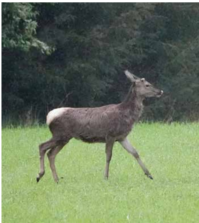
Den 1. maj bliver hjortekalven i forvaltningssammenhæng til en spidshjort.

I henhold til det officielle vildtudbytte for kronvildt udgør spidshjorte knap 15 % af den samlede afskydning. Er det godt eller skidt i forhold til forvaltningsmålsætningerne?