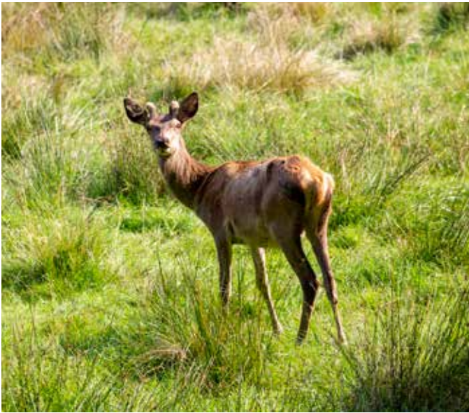
Her en kropsligt meget svag spidshjort i slutningen af august. Når man nedlægger spidshjorte, bør fokus være på at afskyde de svageste individer.